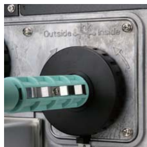
碳帶內外捲自動切換設計 安裝方便、使用簡單