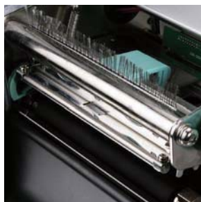
印字頭模組化設計 可輕鬆拆卸及換裝