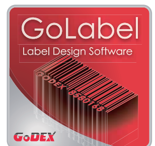
附贈標籤編輯軟體GoLabel 輕鬆製作及列印條碼標籤