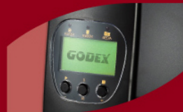
大型背光互動式螢幕