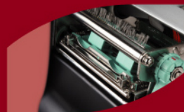
簡易可拆卸印字頭模組